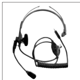
NMN6245 Lekki zestaw nagłowny z mikrofonem i PTT