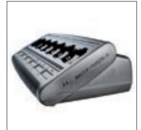
WPLN4189 Ładowarka wielostanowiskowa z wtyczką Euro