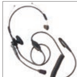
MDJMMN4066 Lekki zestaw nagłowny z mikrofonem i PTT