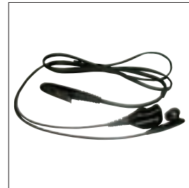
MDPMLN4519 Zestaw kamuflowany 2-przewodowy z mikrofonem, PTT i słuchawką