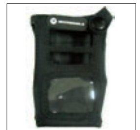
PMLN5090 Pokrowiec nylonowy dla radiotelefonów wodoszczelnych bez wyświetlacza