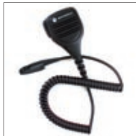
MDPMMN4023 Zewnętrzny mikrofonogłośnik wodoszczelny (spełnia normę IP57)