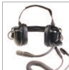
BDN6645 Zestaw nagłowny z PTT do pracy w trudnych warunkach