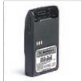
PMNN4074 Wodoodporna bateria Li-Ion (spełnia normę IP57)

Dobra, naładowana bateria jest krytycznym elementem determinującym wykorzystanie radiotelefonu. Radiotelefony serii GP-R pracują z bateriami litowo-jonowymi w wykonaniu standardowym albo iskrobezpiecznym (FM). Dostępne są ładowarki pojedyncze i wielostanowiskowe.