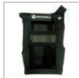
PMLN5089 Pokrowiec nylonowy dla radiotelefonów wodoszczelnych z wyświetlaczem